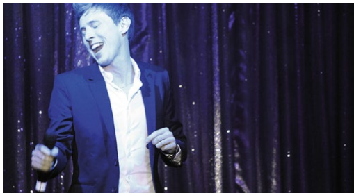
Récital «chanson française» à bord du Costa Classica - Athènes - 2014.