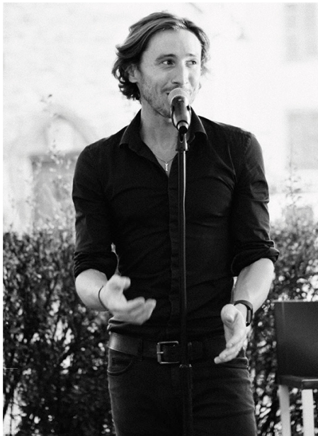
Concert « jazzy » en plein air sur la place du village de Champex (63) - 2018

** avec éclairages (inclus). Sans projecteurs, temps de montage réduit à 20 min.